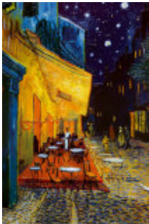
V. Van Gogh

Position of the different elements in the painting and the reasons the artist might have had for those choices.