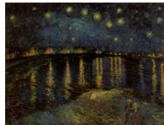
V. Van Gogh