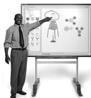
Pizarrón interactivo (IWB)

deber, o bien para debatir el uso de la L2 en situaciones auténticas tomando a los videoclips como modelos.